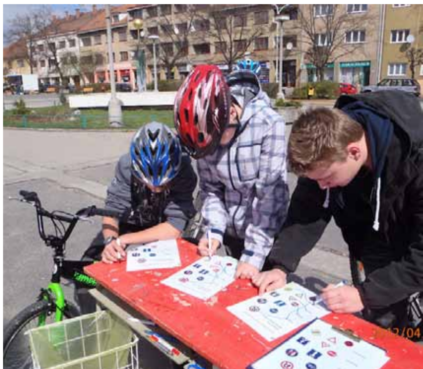
Krumlovské kolečko 2012

Také letos se konal tradiční dopravní závod pro žáky základních škol a Gymnázia. Celé akci předchází výukový program dopravní výchovy na Domečku, který proběhl v lednu.