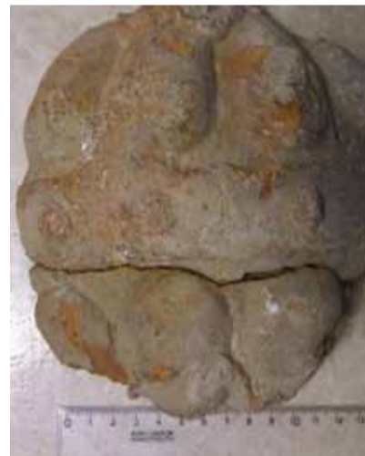
Část terakotového portálu