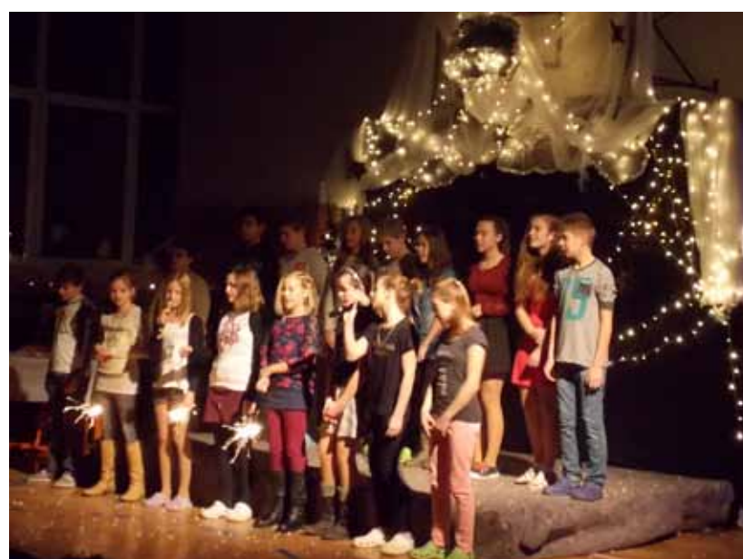
Z vystoupení VI. třídy.