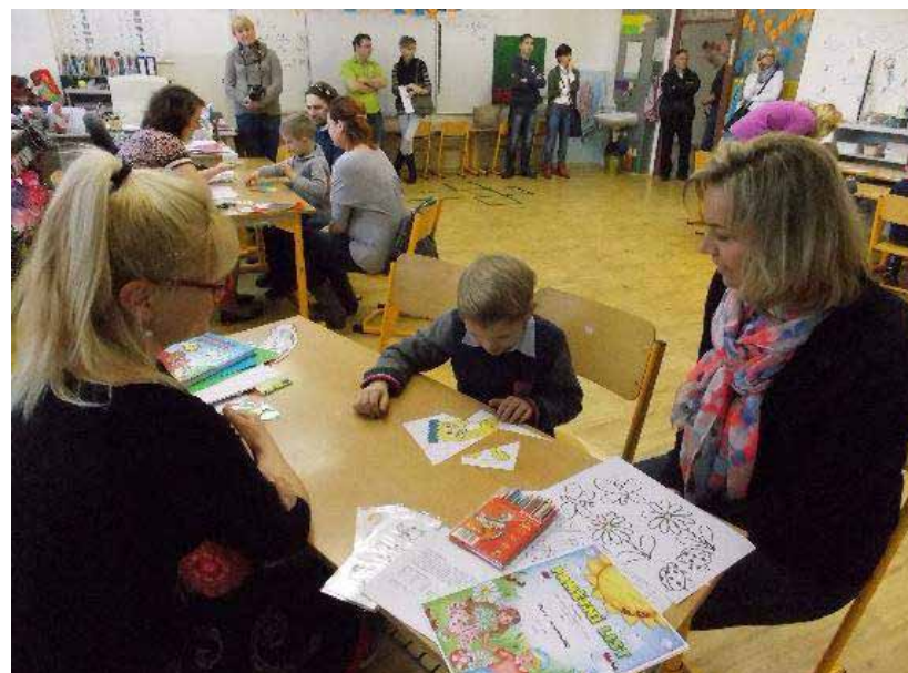
Ze zápisu na ZŠ Ivančická.