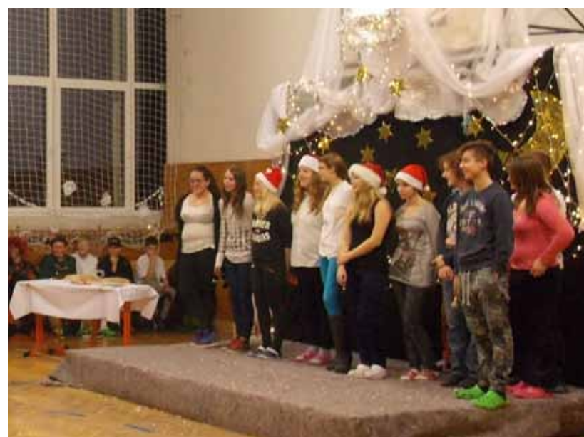
Vtipné vystoupení VIII. třídy.