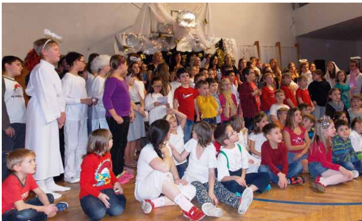
Společné vystoupení dětí a pedagogického sboru navodilo neopakovatelnou atmosféru.