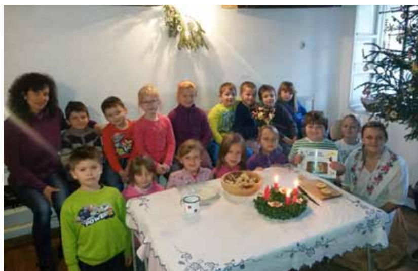
Prvníáci ZŠ Ivančická v doškové chaloupce v Petrovících.