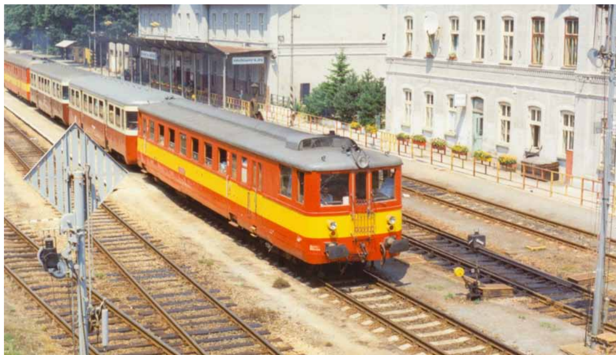
Vlak 831.085 v čele soupravy Os 4509 Znojmo – Břeclav ve stanici Hrušovany nad Jevišovkou v roce 1994.

rách Knížecího domu v Krumlově a je při této příležitosti společně s Jihomoravským muzeem ve Znojmě vydána i výpravná brožura, která je k zakoupení v Městském kulturním středisku. V té souvislosti byla oslovena široká veřejnost. Kromě mnoha jednotlivců se na výsledku podílely například Obecní úřad Silůvky, Vlastivědný spolek Rosicko-Oslavanska, Klub železničních modelářů TT Velké Meziříčí, Moravský zemský archiv Brno, Muzeum Brněnska – Muzeum Ivančice, Národní archiv Praha, Státní okresní archiv Znojmo nebo Centrum dopravního výzkumu. Výstava připomíná rovněž několik zajímavostí – první použití dynamitu při ražení tunelu v Rakousku-Uhersku, pozoruhodné technické stavby s Ivančickým viaduktem v popředí, nejdelší vlečku k jaderné elektrárně Dukovany ad. Zároveň je připomenuta důležitost železnice i v 21. století s potenciálem do budoucna, což potvrzují i nedávná jednání v Brně za účasti čelních představitelů kompetentních institucí k obnovení přeshraničního úseku Láva – Hevlín.