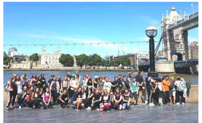
Londýn - červen.