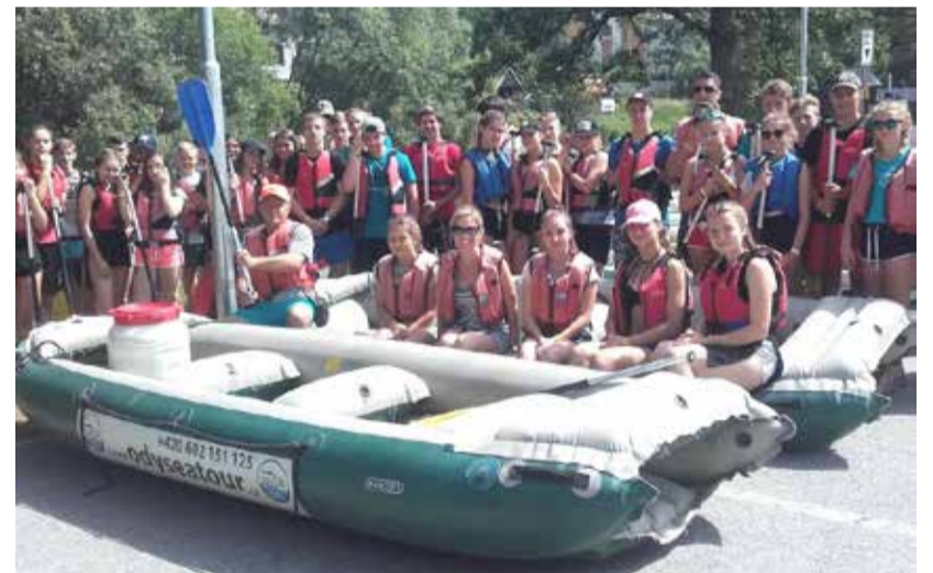
Vodácký výlet - květen.