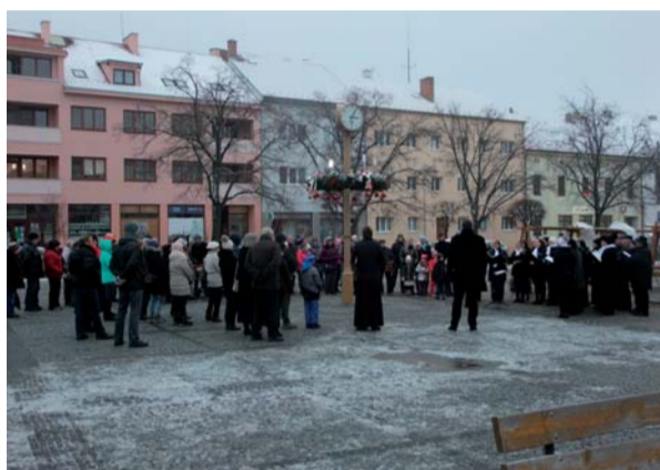
Setkání občanů na náměstí TGM