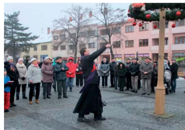
Zehánání adventního věnce