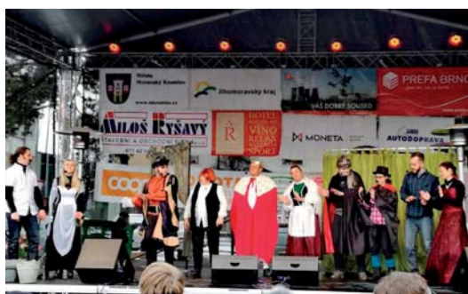
Pohádkový muzikál Princové jsou na draka

SŠDOS Moravský Krumlov Služby Města Moravský Krumlov MěP Moravský Krumlov Hasiči Rakšice