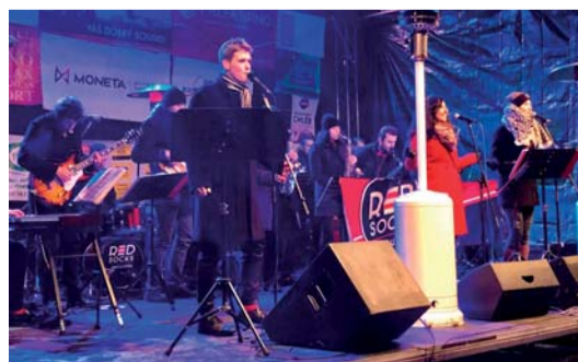
RED SOCKS ORCHESTRA