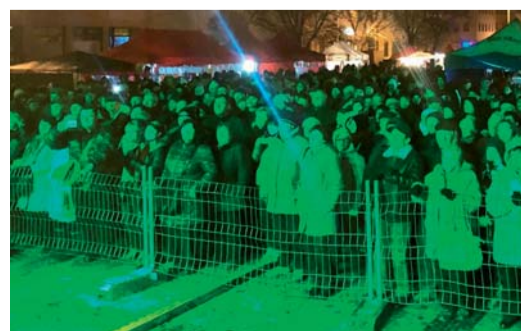
RED SOCKS ORCHESTRA