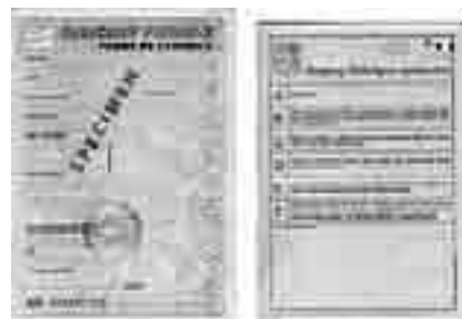
Typ 5: 1997-2000 Povinná výměna: do 31.12.2010