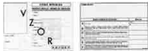
Typ 4: 1994-1996 Povinná výměna: do 31.12.2010

Je vhodné nenechávat výměnu až na poslední dny lhůt stanovených zákonem č. 361; jen tak se lze vyhnout případným návalům na správním úřadě.