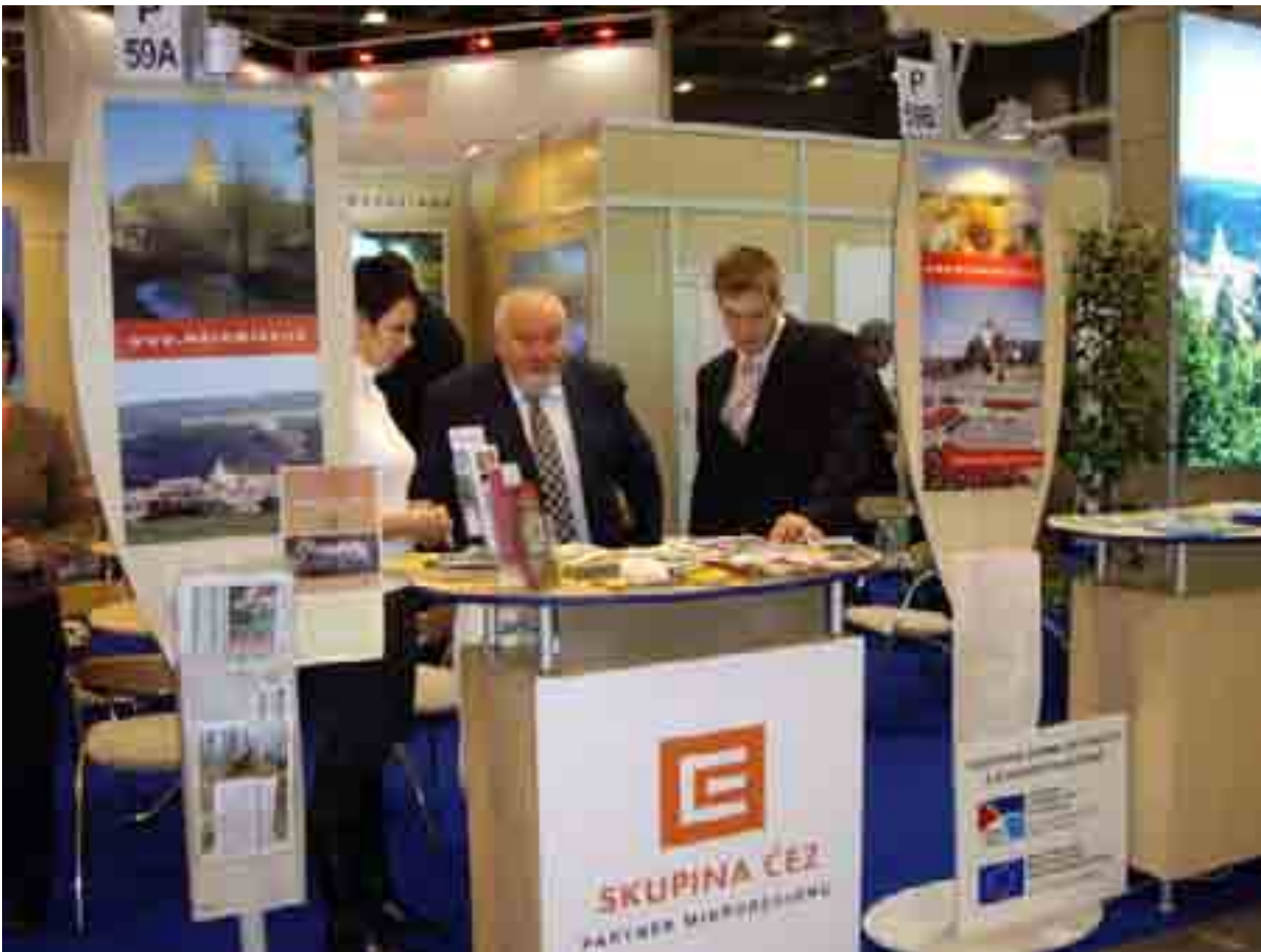
Expozice Moravského Krumlova a mikroregionu Moravskokrumlovsko na letošním veletrhu REGIONTOUR.