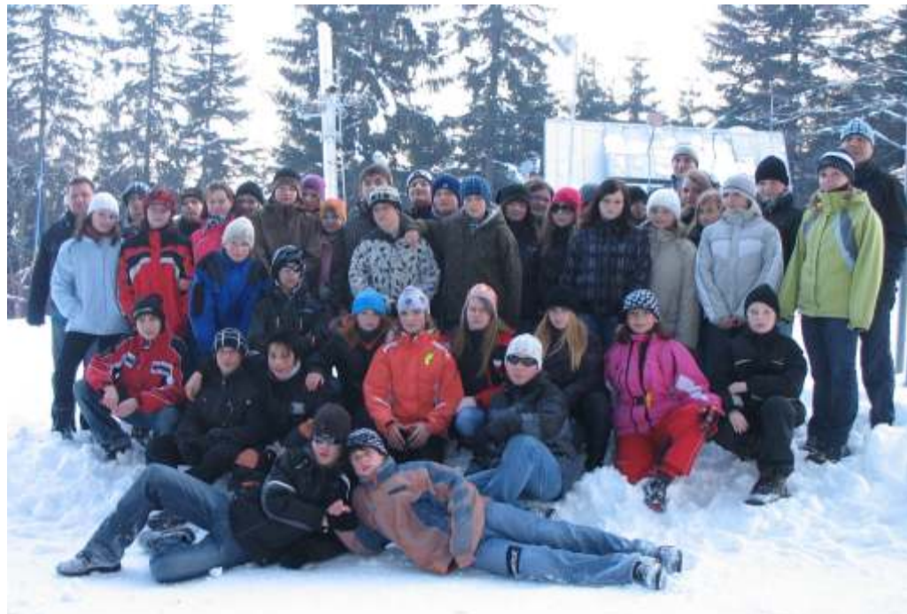
V týdnu od 6. do 13. února absolvovali děvčata a chlapci ze sedmého a osmého ročníku lyžařský výcvikový kurz ve Starých Hamrech.