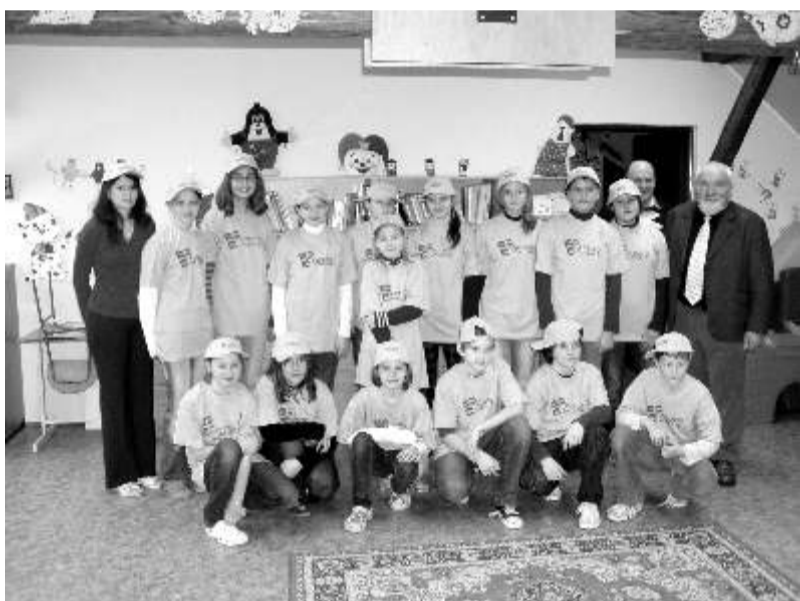
Výherci soutěže, žáci pátého až osmého ročníku ze ZŠ Klášterní.

slavíme masopust. Téměř všechny děti si přinesly masku, kterou jim připravili rodiče. Našli se i jedinci, kteří odmítali na sebe cokoli navléknout. Ale nic to neměnilo na tom, že se dostatečně dobře bavili. Na programu celého dopoledne se podíleli všichni