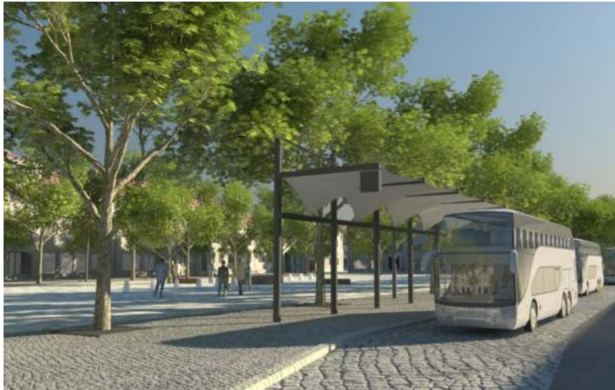
Vizualizace nové podoby zastávek na náměstí T. G. M.

V jarních měsících započnou ve městě stavební práce na vybudování nového autobusového nádraží u řeky s předpokládaným ukončením v závěru letošního roku. V návaznosti na tuto investiční akci bude možné zrušit autobusová stání na nám. T. G. Masaryka a v dalším období přistoupit k revitalizaci centra města. Další významnou investicí bude rekonstrukce silničního průtahu městem III/4133 v polovině letošního roku, která bude zahájena na ulici Zámecká a bude pokračovat vybudováním zastávkových závlivů na náměstí T. G. Masaryka. Spolu s povrchem komunikace město vymění ve spolupráci s energetickou společností i veřejné osvětlení. Mezi další akce patří oprava kanalizačního řadu v rámci projektu Dyje II (okrajové části města – ulice Tiskárenská, K. H. Máchy, kpt. Jaroše a další) a zateplení pavilónového objektu Základní školy na Ivančické ulici. Dověří se tak dvouleté úsilí na projektech a žádostech o dotace.