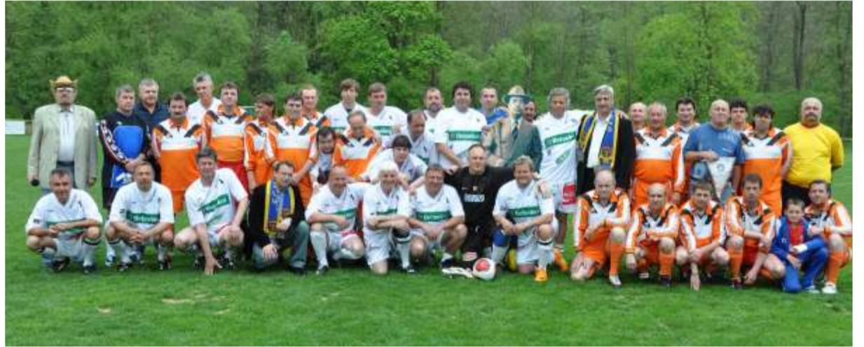
Menšíkova 11 spolu se „starou gardou“ FC Moravský Krumlov.