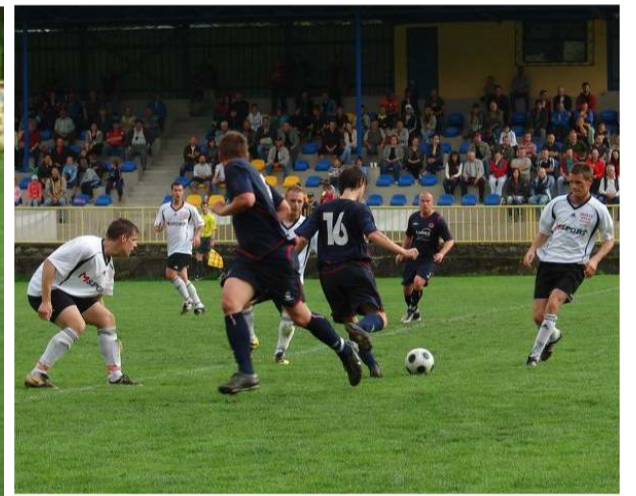
Bojovou atmosféru při fotbalových oslavách zachycují snímky L. Pelikánové.

Vrabčák hudební festival moravský krumlov