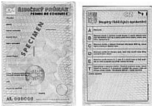
Typ 5: 1997-2000 Povinná výměna: do 31. 12. 2010