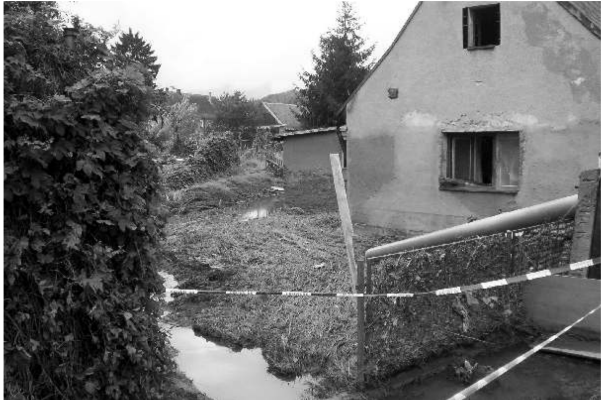
Povodní postižený dům v Bílém Kostele nad Nisou, určený k demolicí.