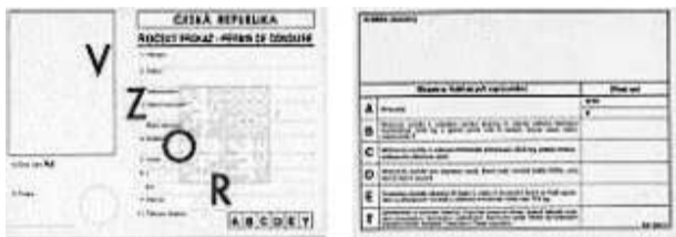
Typ 4: 1994-1996 Povinná výměna: do 31. 12. 2010

Je vhodné nenechávat výměnu až na poslední dny lhůt stanovených zákonem č. 361; jen tak se lze vyhnout případným návalům na správním úřadě.