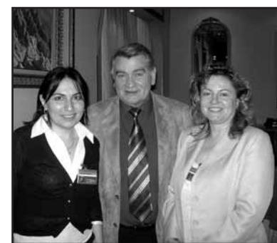
Prezident ETUCE (organizace sdružující učitele v Evropě) a kolegyně z Gruzie