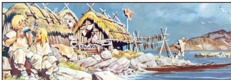
Rekonstrukce neolitické rybářské vesnice

Na kulturu lineární navázala KULTURA S KERAMIKOU VYPÍCHANOU (VK, 5000/4900 - 4500 přnl.) náleží již do mladšího neolitu. Celá kultura dostala název podle typické vypíchané výzdoby na nádobách. Výzdoba byla prováděna vícečetným kostěným nástrojem, který určoval tvar i souběh vpichů. Nad formováním kultury s VK visí řada otázek. Soudí se, že se kultura s VK rozvíjela přímo ze šáreckého stupně LnK, ale také se mohly na jejím