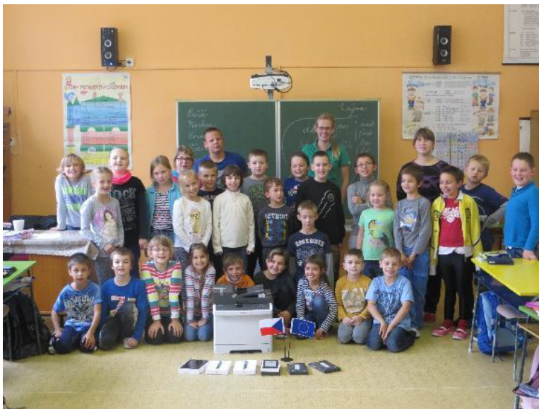
1 Děti z Jiřic s projektovým vybavením - čtečky, tablety, vlaječky a psycholožka

Kariérní poradenství jsem nabízela žákům 9. tříd s cílem pomoci jim v rozhodování o dalším směřování a vyhnout se tak nevhodné volbě a případnému předčasnému ukončení vzdělání. Jeho součástí byl velký test inteligence, z kterého lze (s určitou dávkou opatrnosti a s přihlédnutím k pílí a známám žáka) usuzovat, jakého stupně vzdělání může dosáhnout a jestli je žák lepší ve verbálních, numerických, nebo prostorových úlohách. Dále žáci vyplňovali osobnostní test a dotazník zájmů (zúčastněným učitelům děkuji za spolupráci). Také volně odpovídali na otázky spojené s jejich budoucím směřováním. Když jsem měla tuto baterii kompletní, vyhodnocovala jsem testy a tvořila profily žáků s jejich silnými a rozvojovými stránkami. Potěšilo mě, že výsledky většiny již rozhodnutých žáků odpovídaly jejich dalšímu směřování. Na některých školách už proběhlo předávání