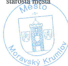
Mgr. Tomáš Třetina starosta města