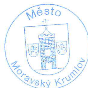
Mgr. Tomáš Třetina starosta města